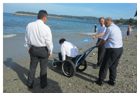
「公明ひらつか」議員視察