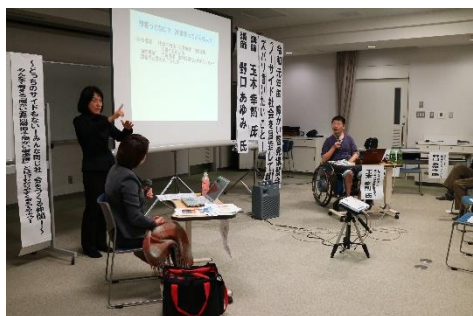
鳥羽市障がい啓発講習会