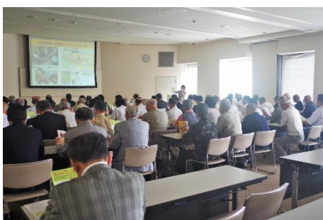
寝屋川市市政協力委員視察