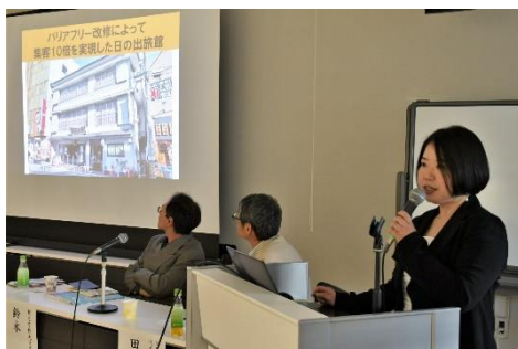
建築士会全国大会 北海道大会