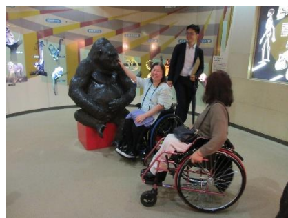
千葉県バリアフリー調査研修